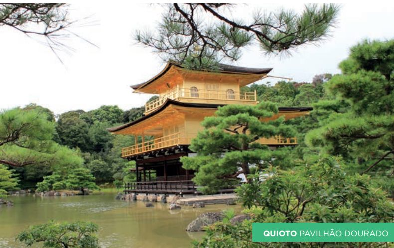
QUIOTO PAVILHÃO DOURADO