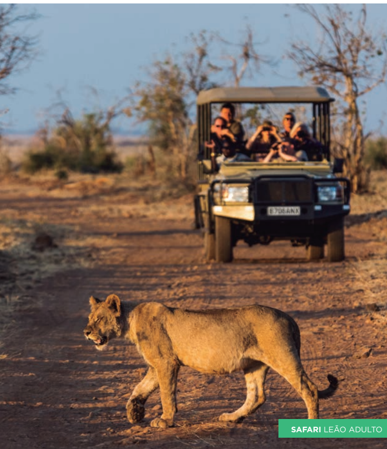
SAFARI LEÃO ADULTO

1º DIA: LISBOA - KILIMANJARO - ARUSHA SA Comparência no aeroporto 2 horas antes da partida do voo indicado. Formalidades de embarque e partida com destino a Kilimanjaro, via cidade (s) de conexão. Chegada, assistência do nosso agente local e transfer a Arusha. Alojamento.