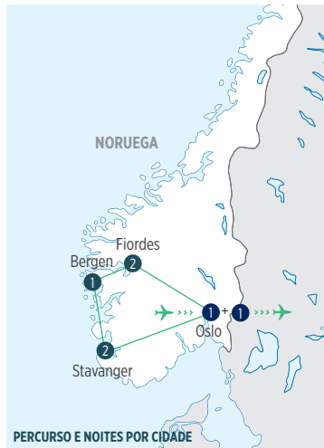
PERCURSO E NOITES POR CIDADE