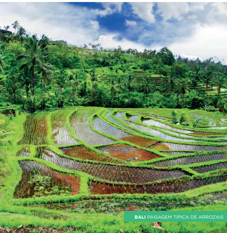
BALI PAISAGEM TÍPICA DE ARROZAI