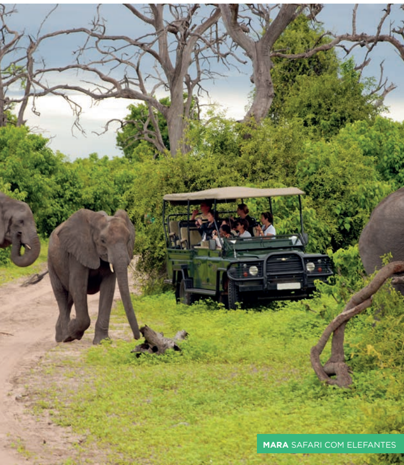
MARA SAFARI COM ELEFANTES