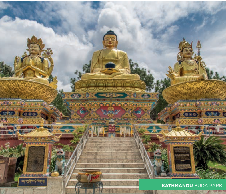
KATHMANDU BUDA PARK