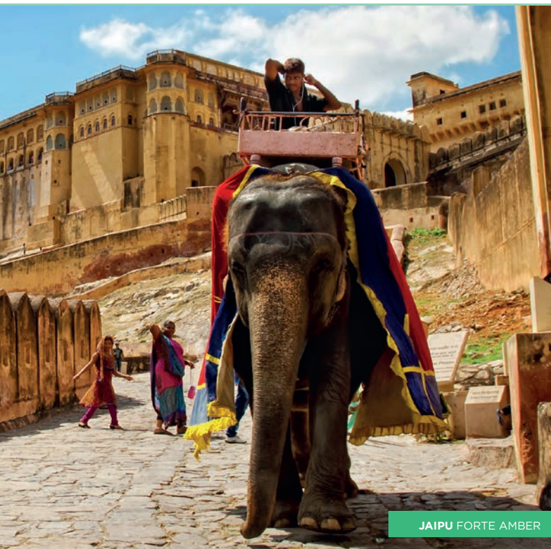
JAIPUR FORTE AMBER