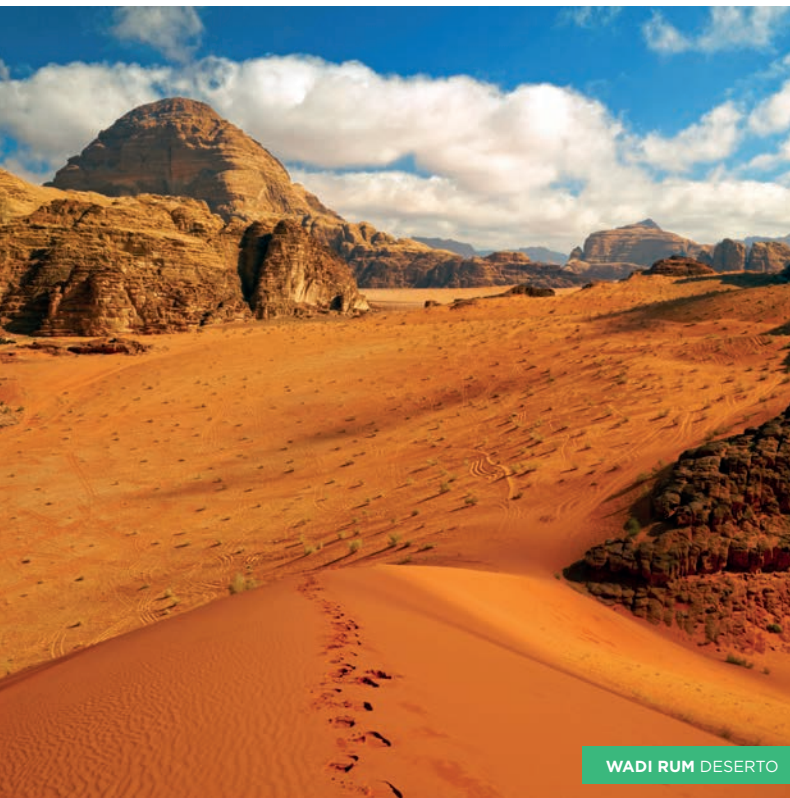
WADI RUM DESERTO