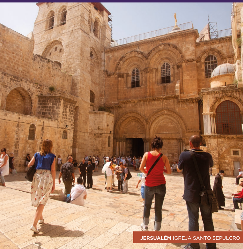
JERUSALÉM IGREJA SANTO SEPULCRO