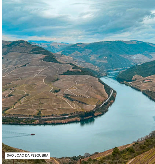
SÃO JOÃO DA PESQUEIRA