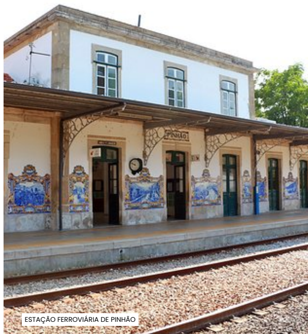
ESTAÇÃO FERROVIÁRIA DE PINHÃO