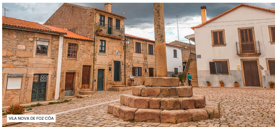
VILA NOVA DE FOZ CÔA