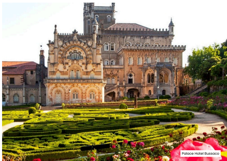
Palace Hotel Bussaco

Após o almoço, seguimos para o Bussaco . Visita à Mata Nacional do Bussaco , uma área protegida com espécies vegetais de todo o mundo: visita ao exterior do Palace Hotel Bussaco e aos seus jardins . Passagem pela estância termal do Luso . Em hora a indicar regresso via autoestrada, A1 até aos locais de fim de viagem. Fim de viagem e dos nossos serviços.