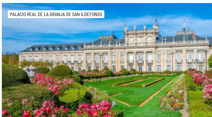
PALÁCIO REAL DE LA GRANJA DE SAN ILDEFONSO