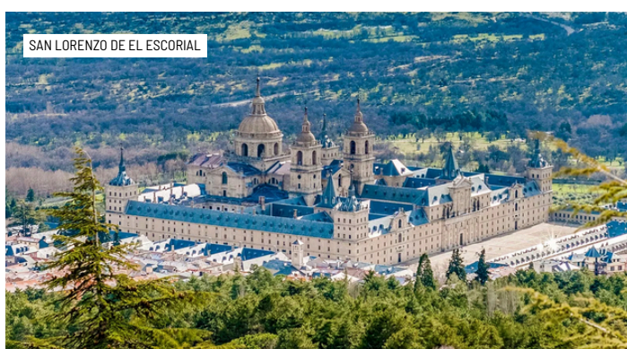
SAN LORENZO DE EL ESCORIAL