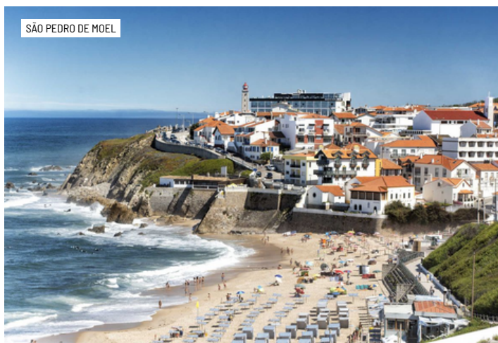
SÃO PEDRO DE MOEL