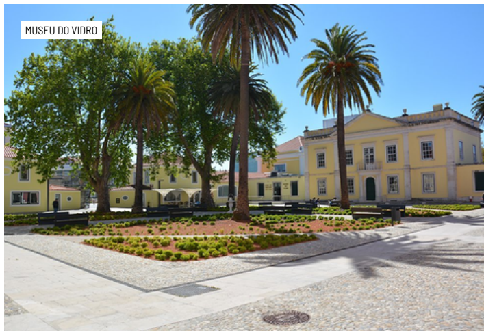
MUSEU DO VIDRO

Condições: Viagem sujeita a mínimo de 25 participantes.