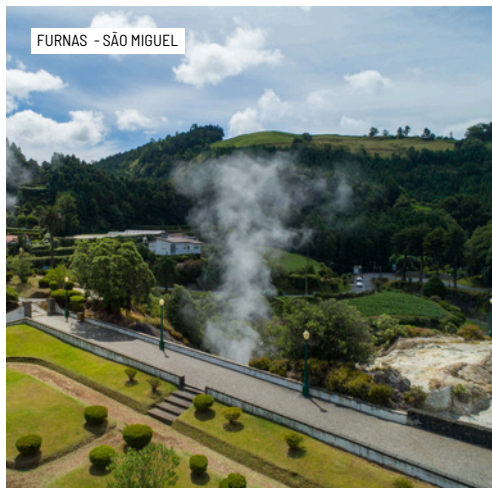
FURNAS - SÃO MIGUEL

*Quando a visita coincidir com feriado ou outro dia de encerramento dos museus previstos no programa, o guia proporá visitas alternativas, com entrada incluída.