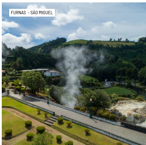
FURNAS - SÃO MIGUEL

4º DIA – FLORES / CORVO (VISITAS) / FLORES - PC Após o pequeno-almoço buffet no hotel, transporte para o porto das Flores e saída para a ilha do Corvo, considerada pela UNESCO reserva da biosfera e onde se encontra “a mais remota aldeia da Europa”. O passeio começa serpenteando a costa nordeste da ilha das Flores em velocidade reduzida na reserva ambiental para avistamento de aves marinhas, passando por lindíssimas cascatas, ilhéus, rochas de diferentes formações, grutas com lendas do tempo dos descobrimentos e a cor fantástica do azul oceânico dos Açores, com grandes possibilidades de ver golfinhos e até baleias. Após o desembarque na Vila Nova do Corvo, transporte de minibus de 8 passageiros para visita à cratera “O Caldeirão”, situada no topo da ilha. No regresso, passagem pelos miradouros com uma vista panorâmica sobre a vila. Já no centro da vila, almoço em restaurante local. Passeio pela parte antiga entre ruas e canadas estreitas fotografando os traços arquitetónicos, seguido de visita ao centro de interpretação ambiental. Tempo livre, antes do regresso ao porto. Embarque e travessia de mais ou menos 40 minutos até à Ilha das Flores. Regresso ao hotel. Jantar e alojamento.