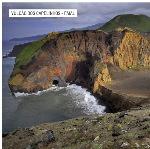
VULCÃO DOS CAPELINHOS - FAIAL