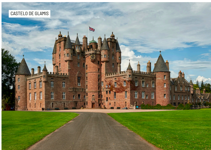
CASTELO DE GLAMIS