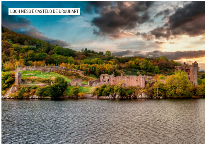
LOCH NESS E CASTELO DE UROUHART