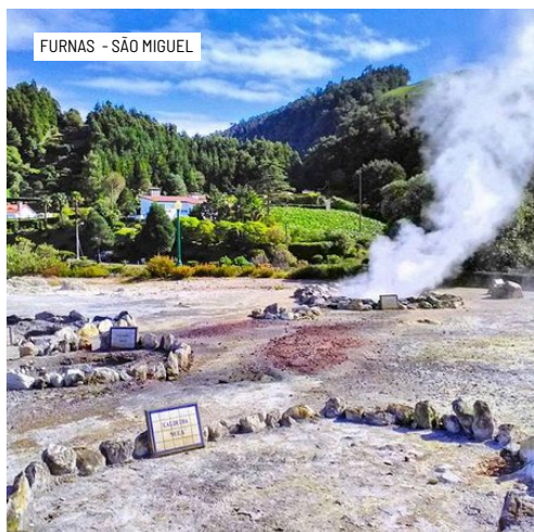
FURNAS - SÃO MIGUEL

Pequeno-almoço buffet no hotel. Em hora a informar localmente, início da visita de dia inteiro à parte oriental de São Miguel. Breve paragem em Vila Franca do Campo, primeira capital da ilha e subida até ao Pico do Ferro (vista panorâmica para a caldeira das Furnas)*. Nas Furnas, visita ao romântico parque Terra Nostra, (com possibilidade de banho na piscina termal de águas férreas, a mais de 30 graus), às “Caldeiras” (Fumarolas das Furnas) – fenómeno vulcânico com características únicas, e à Lagoa das Furnas, de cujas margens será retirado, de buracos no solo, o “Cozido”. Almoço de “Cozido das Furnas”, servido no restaurante do Hotel Terra Nostra. De tarde, passagem pela vila da Povoação, onde se iniciou o povoamento da ilha, e pelo concelho do Nordeste, com os seus famosos jardins e cascatas. Paragem no Miradouro da Ponta do Sossego, passagem na vila de Nordeste e visita ao Parque Natural da Ribeira dos Caldeirões. Ao fim da tarde, chegada às plantações de chá, únicas na Europa, na zona da Gorreana e Porto Formoso, com visita a uma fábrica e prova de chás verde e preto. Regresso a Ponta Delgada. Jantar no hotel, seguido de serão cultural, com música tradicional e contemporânea açoriana. Alojamento.