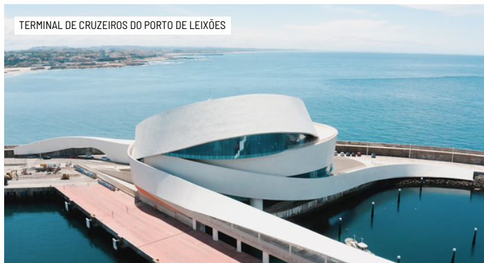
TERMINAL DE CRUZEIROS DO PORTO DE LEIXÕES