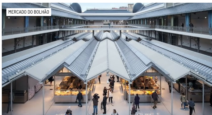
MERCADO DO BOLHÃO