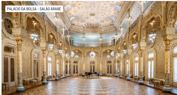
PALÁCIO DA BOLSA - SALÃO ÁRABE