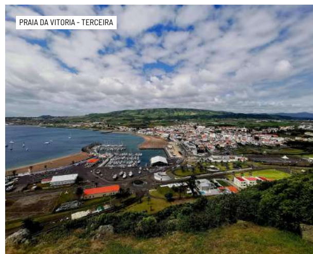
PRAIA DA VITORIA - TERCEIRA