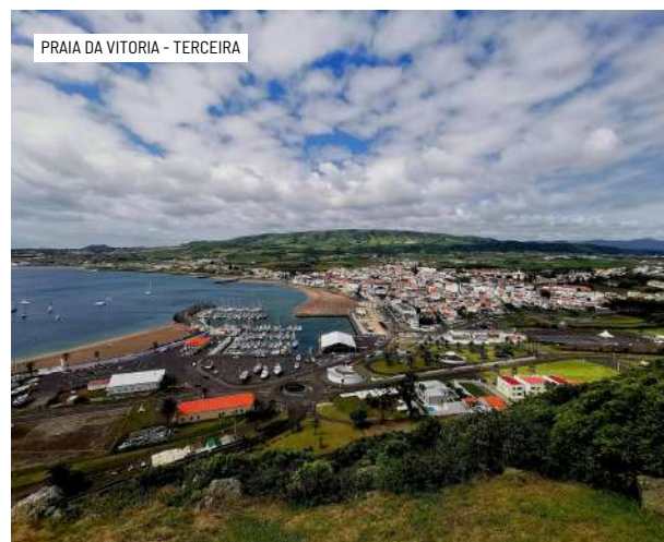
PRAIA DA VITORIA - TERCEIRA