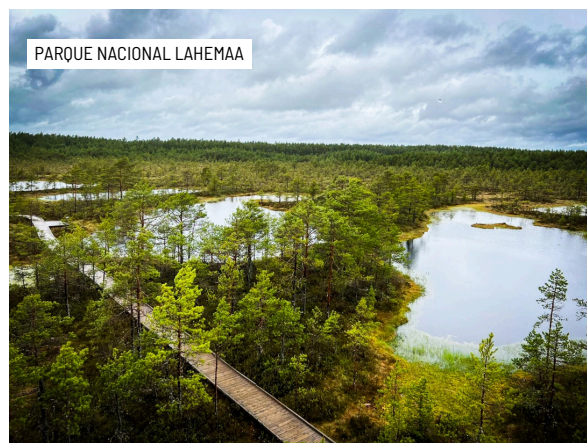
PARQUE NACIONAL LAHEMAA