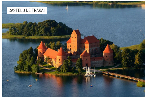
CASTELO DE TRAKAI