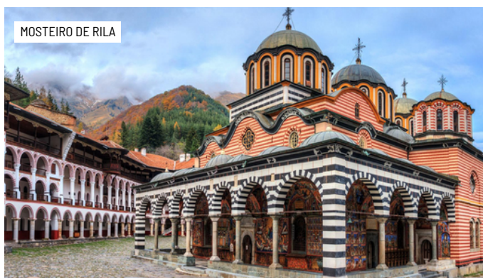
MOSTEIRO DE RILA