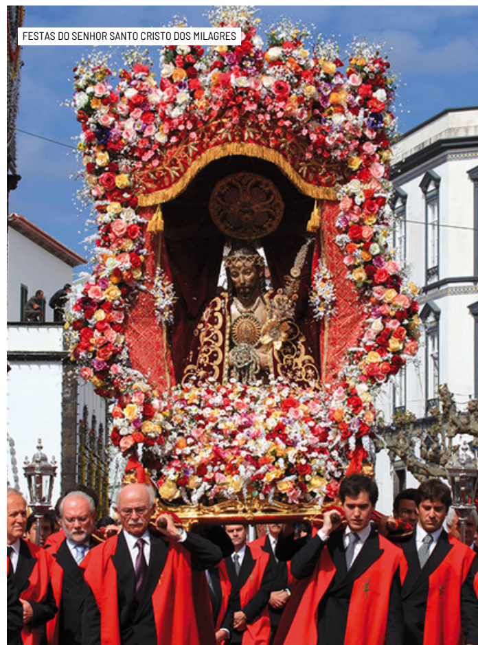
FESTAS DO SENHOR SANTO CRISTO DOS MILAGRES