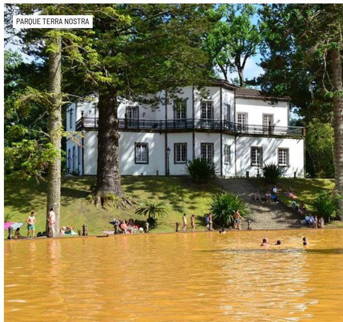
PARQUE TERRA NOSTRA