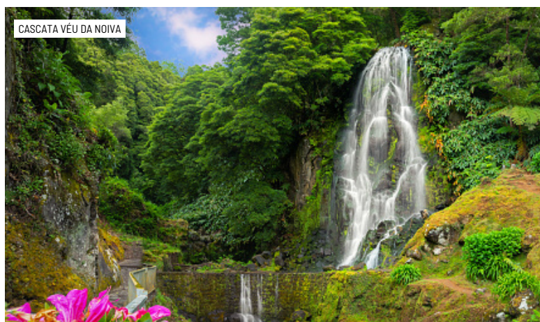
CASCATA VÉU DA NOIVA