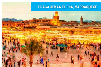
PRAÇA JEMAA EL FNA, MARRAQUEXE