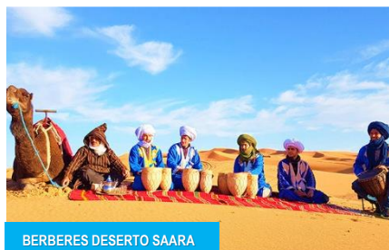
BERBERES DESERTO SAARA

Pequeno-almoço no hotel. Saída para o Ksar de Ait-Bem-Haddou , cidade Património da Humanidade pela UNESCO. Visita desta cidade fortificada, uma das maiores e mais bem conservadas de Marrocos, onde já foram gravados filmes como o Gladiador ou a Múmia. Continuação através da cordilheira do Alto Atlas com passagem pelo impressionante Alto do Tichtka, a 2.260 metros com destino a Marraquexe . Jantar e alojamento no Hotel Meryem**** ou similar.