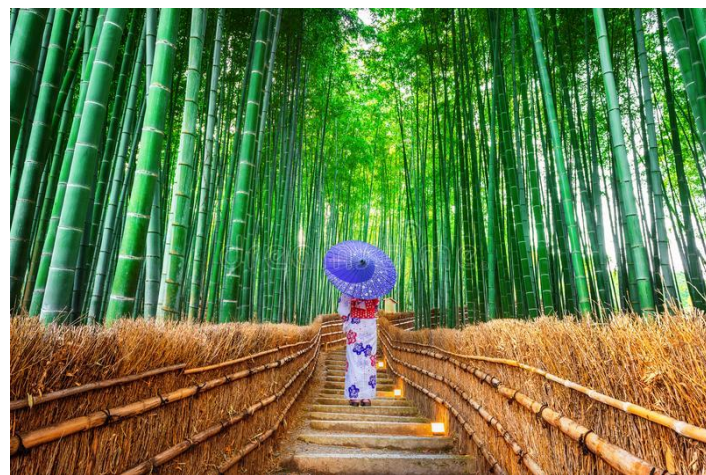
FLORESTA DE BAMBU EM ARASHIYAMA