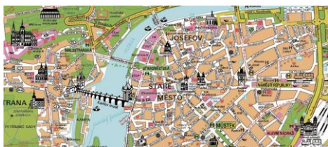
MAPA DE PRAGA CASA DANÇANTE DE PRAGA

EXCLUINDO: Jantar do 1º dia, outras refeições, bebidas, e visita opcionais. Suplemento quarto IND. – € 225,00