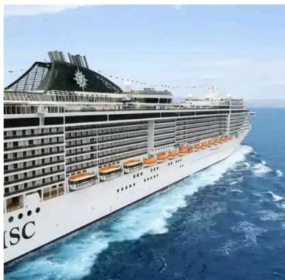
MSC SPLENDIDA (vista exterior)