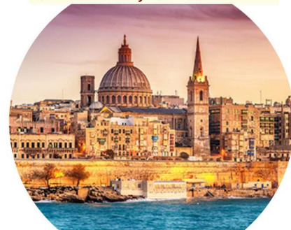
LA VALLETTA, MALTA