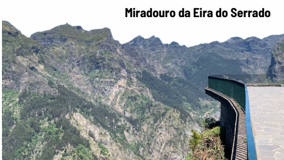
Miradouro da Eira do Serrado

Em hora e local a combinar, partida para o aeroporto do Porto para embarque com voo com destino ao Funchal. Chegada e início de excursão em direção ao Miradouro da Eira do Serrado. Situado a 1094 metros de altitude, pode-se desfrutar de uma deslumbrante paisagem sobre o Curral das Freiras, vila edificada num vale de erosão. Continuação até à freguesia do Monte para visita à Igreja da Nossa Senhora do Monte, (onde se encontra o túmulo do último Imperador da Áustria, Carlos I) e aos seus magníficos jardins públicos. Possibilidade de descida nos carros de cestos típicos até ao Livramento. Transporte até ao hotel e resto de dia livre. Jantar no hotel.