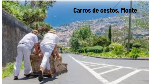
Carros de cestos, Monte

Após pequeno almoço, saída para excursão de dia inteiro. Visita a Camacha, local conhecido pelo seu artesanato. De seguida, subiremos até ao Pico do Areeiro, o terceiro cume mais alto da ilha.